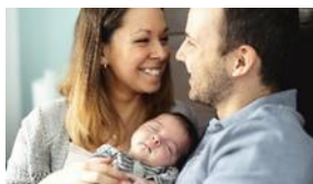
Mütter- und Väter Beratung