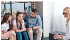
Jugend-, Ehe- und Familien Beratung